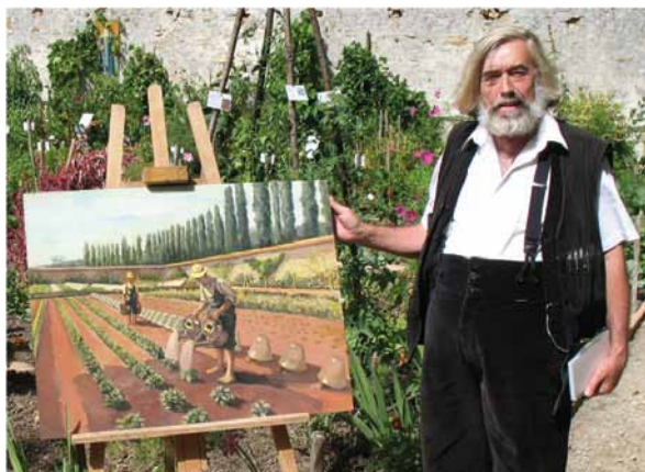
Concours parrainé par Claude BUREAUX Ancien chef jardinier du Jardin des Plantes de Paris Chroniqueur jardin sur France Info

pour voir l'œuvre de votre classe exposée lors des Floralies Internationales - Nantes du 8 au 18 mai 2014