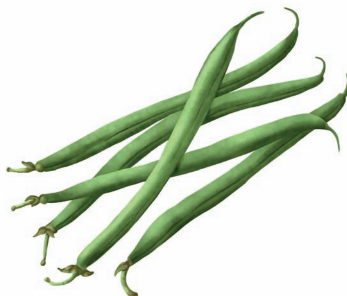
HARICOTS VERTS Haricots verts