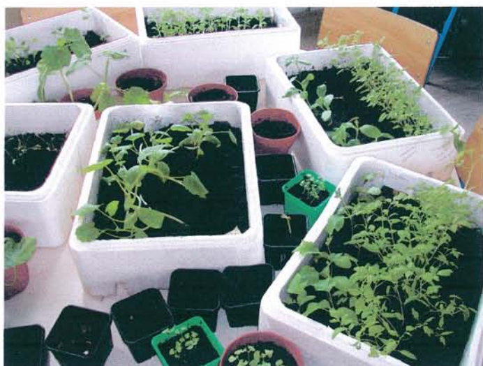
Nos semis en classe