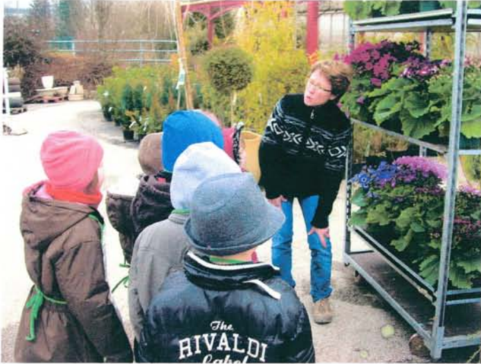
Notre visite à la jardinerie