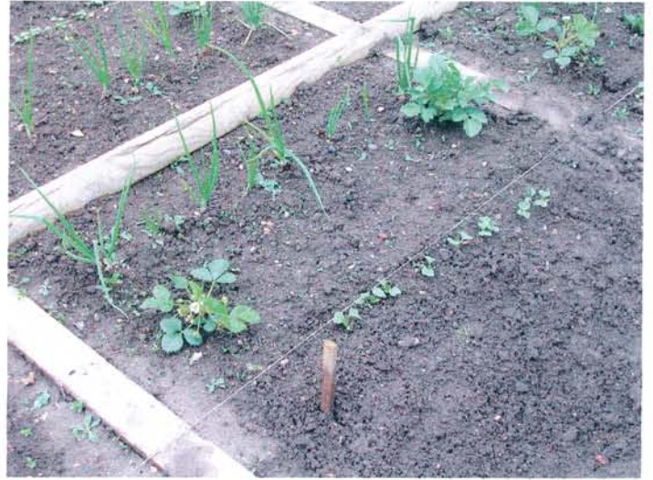
Un de nos 23 carrés de jardin

Nous sommes allés jeudi 30 mars à la jardinerie du Cardonnoy à Aumale lors de la « semaine du jardinage pour les écoles ». On a fait des semis et d'autres ateliers.