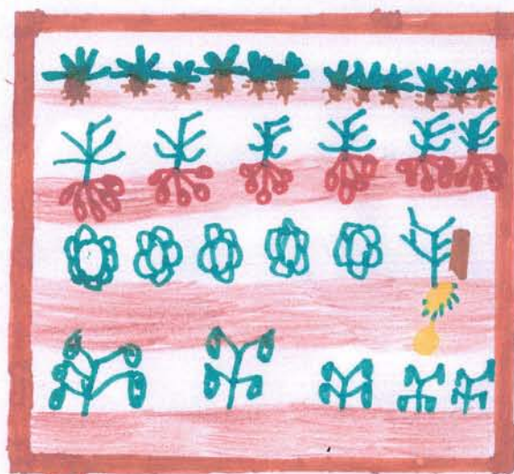
Le dessin d'un carré potager