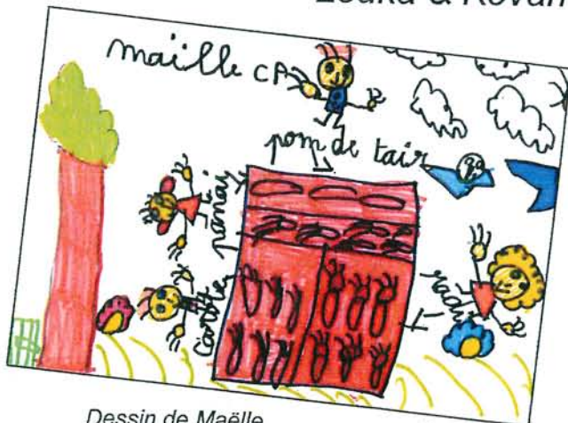
Dessin de Maëlle